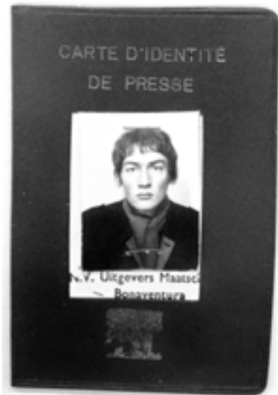
Fig. 01. Carnet de prensa de Rem Koolhaas en los años sesenta.