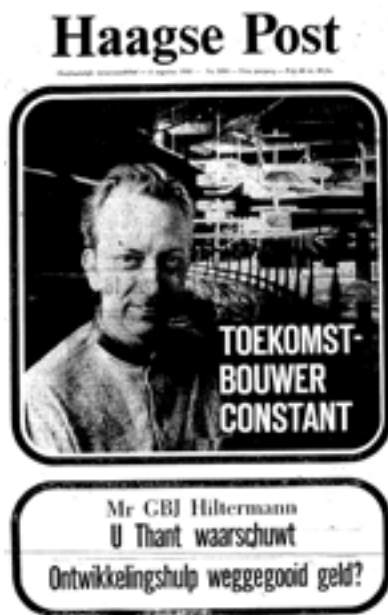
Fig. 04. Portada del HP nº 2694, en el que se incluye la entrevista a Constant.

origen-provos, provos-sociedad, sociedad-creatividad, creatividad-tiempo,... Un discurso diseñado con el objetivo de definir la esencia del objeto de la entrevista: el New Babylon . Las contestaciones van despertando el interés del entrevistador más escéptico al principio y pasa a una estructura más cerrada sobre este tema cuestionando cada contestación con réplicas breves de tipo exclamativo que dan pie a explicar información para presentar más creíble algo que a priori consideraba irrealizable: